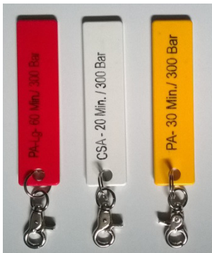
codierte Truppuhren-Plaketten für 60/20/30 min