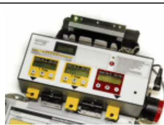
Einsatztimer mit Truppuhreinheit